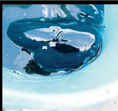
För att lugna malen inför mätning läggs den i en spann med bedövningsmedel...

TEXT OCH FOTO: JOHAN KRISTENSSON johan.kristensson@smp.se